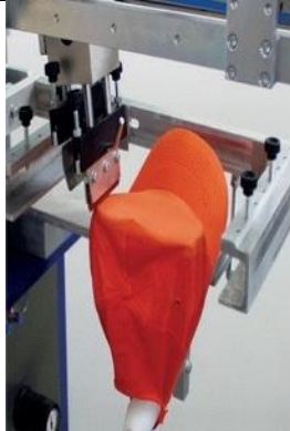
CK Dispositif pour l'impression de casquettes, chapeaux