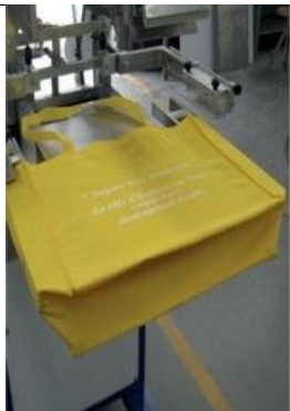
CB Dispositif avec plan et barres d'expansion pour l'impression de sacs publicitaires