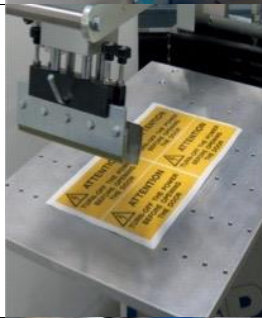
CH Dispositif avec aspiration (pompe incluse)