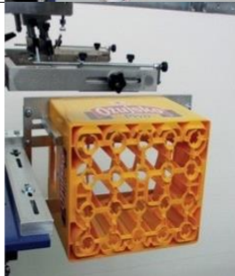
CZ Dispositif pour l'impression de caisses porte-bouteilles