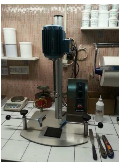
Disperseur 0-4000 t/mn