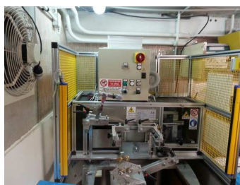
Mini/3 - GPE Ardenghi