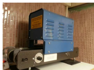
Sécheur UV Technigraf